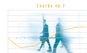
* Graphique théorique de la courbe en J de tout fonds de capital investissement, sans valeur contractuelle *

Pour information, les modèles de rendement des fonds de capital investissement, qui ordinairement adoptent une politique d'investissement basée sur le long terme, sont fréquemment matérialisés sous la forme d'une « courbe dite en J ».